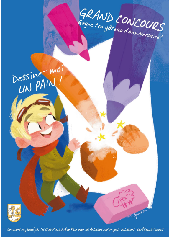
Concours organisé par les Chevaliers du Bon Pain pour les Artisans boulangers-pâtisseries-confiseurs vaudois